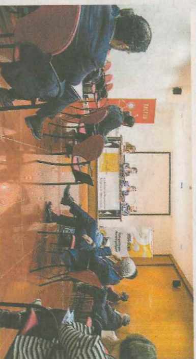
Los ponentes explicaron su modelo de negocio y sus vivencias.